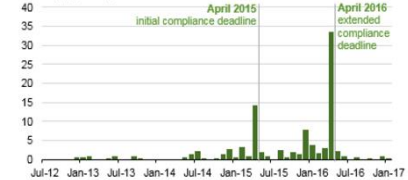
Activated carbon injection emissions control installed on coal-fired generators capacity (gigawatts)